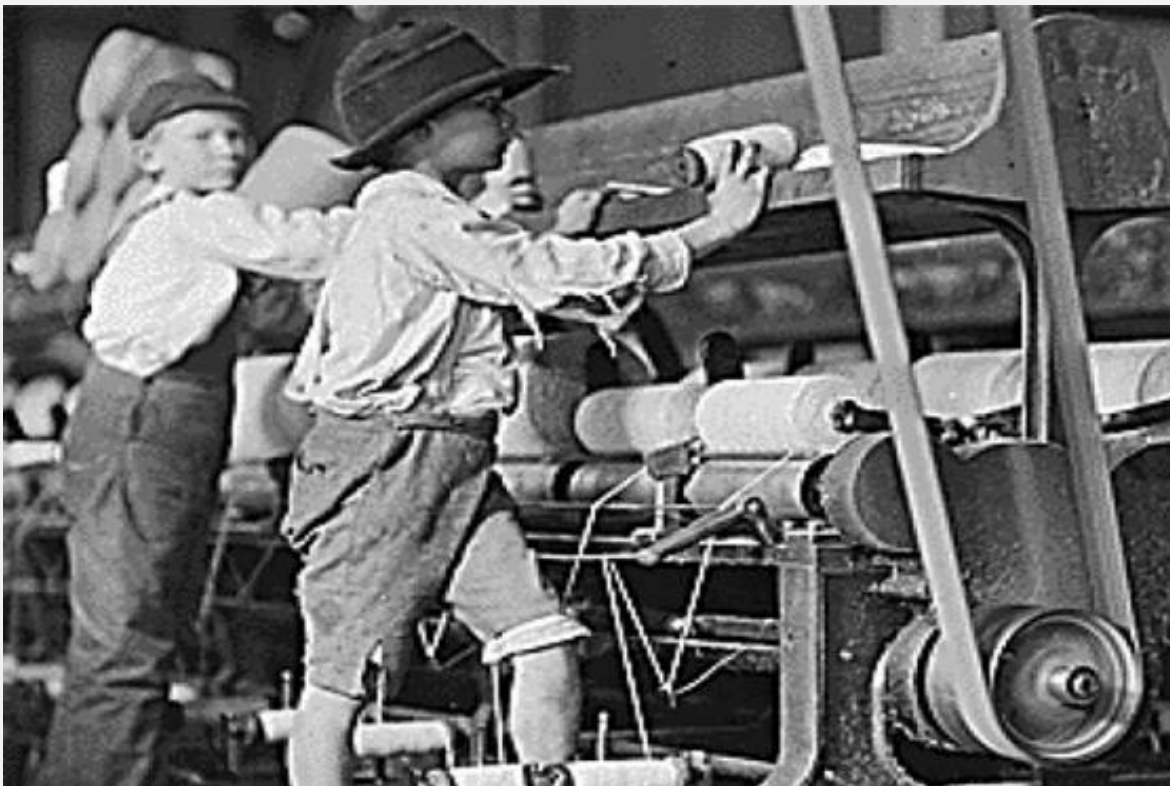
IMAGEN SACADA DE LA WEB SIN FINES LUCRATIVOS

Como se puede observar, los niños siempre han sido utilizados con crueldad y “perversidad” y digo siempre; porque estas mismas gentes continúan utilizando los niños ya sea para ofrecerlos como ofrendas sexuales o en sangrientos rituales o como donadores de órganos, peor aún, están legalizando el abuso sexual de la niñez, el incesto, la pedofilia y para re-matar, están “socializando” (imponiendo) a nivel global el adoctrinamiento de la “ideología de género” para “convertir” el niño en niña y la niña en niño, entre tanto los movimientos del feminismo convertidos en ideologías están diseccionando las relaciones entre el hombre y la mujer – es urgente la creación de una verdadera ONG, independiente, valiente y honesta que se dedicara a investigar y a denunciar quienes están detrás de estas hermenéuticas de la configuración cromosómica o sexualidad, “quienes” son los que desde las sombras están imponiendo la sexualidad psicológica ante la sexualidad biológica en la niñez y a la sociedad en general, el porqué de la “misteriosa” desaparición de la niñez en el mundo y a que “lugar” y cultos son llevadas estas criaturas para ser utilizados brutal-mente como objetos sexuales y terminar consumidos en sangrientos rituales, pues si no lo sabías, estas gentes se “empoderan” o se “embrujan” con sangre y carne humana... ¿llegará el día en que la humanidad este fuera del peligro de esta gentuza ?