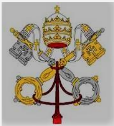
IMAGEN SACADA DE LA WEB SIN FINES DE LUCRO

es, que recuperen una mentalidad propia, o bien sea, una mente que no haya sido asignada por imposición (religión) ni por indisposición (ignorancia o desinformación) sino, por una renovada visión de mundo rescatada y engendrada por el valor autentico de las palabras, el cual nos permitirá descubrir los ardides que se han valido los ideólogo-religiosos para confundir y someter a la humanidad bajo su dominio. No existen otros caminos o senderos para recuperar la actividad neuronal que le ha sido arrebatada a la humanidad, solamente existe uno, el sendero o camino de LA PALABRA: “ la palabra es una luz en mi sendero ” (salmo-119:105 Nun). Con palabras engañosas han confundido y esclavizado a la humanidad, pero con palabras auténticas la humanidad se iluminará y se auto-liberará de las garras de los “malignos” y con palabras auténticas les estará quitando de “las manos” a estos míseros “malignos” guardianes de “las llaves de Dios”* el poder de continuar dominando con palabras engañosas.