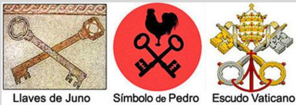
IMÁGENES SACADAS DE LA WEB SIN FINES LUCRATIVOS

Lamentable-mente la voluntad humana ha sido sitiada por quienes obstaculizan la evolución psico-espiritual de los seres, en especial, por esas doctrinas religiosas y filosóficas que continuamente se elaboran y se re-elaboran para generar y perpetuar la confusión mental-espiritual de los seres, pues de momento, este “evolucionar espiritual” ha sido solo para algunos “pocos” y esos “pocos” son precisamente los que doblegan a los seres humanos introduciendo imágenes en vez de palabras y las palabras que introducen en la mente humana son solo palabras esqueléticas que no contribuyen a la elaboración cognitiva y por consiguiente a la transformación energética de la materia. El legado de los antiguos, me refiero a los del anterior macro-ciclo fue el conocimiento y la información pertinente para que esta humanidad pueda continuar evolucionando en el presente rango de espiritualidad, solo que “las llaves” (claves) que permiten la continuación; está en poder de estos “pocos”, pues este conocimiento e información ha permanecido retenido y a la humanidad solo se le permite ver simbólica-mente esas “llaves” que lo ocultan, (ver imagen) y ver “aquello” que, aunque no está oculto, permanece “visiblemente oculto”, (ver E/h n°10) pues para “ver” de esta manera la mente ha sido diseñada y programada , ha sido y continua siendo adiestrada (por el dominio de la mano derecha) para pseudo-configurarse en la confusión y el engaño; o bien sea, en el mito.