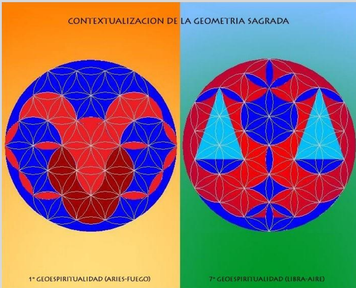
IMAGEN PROPIA-CONTEXTUALIZACION GEOMETRIA SAGRADA-LA FLOR DE LA VIDA-LA LEGISLACION Y LA DISTRIBUCION (LA LEY Y LA JUSTICIA)