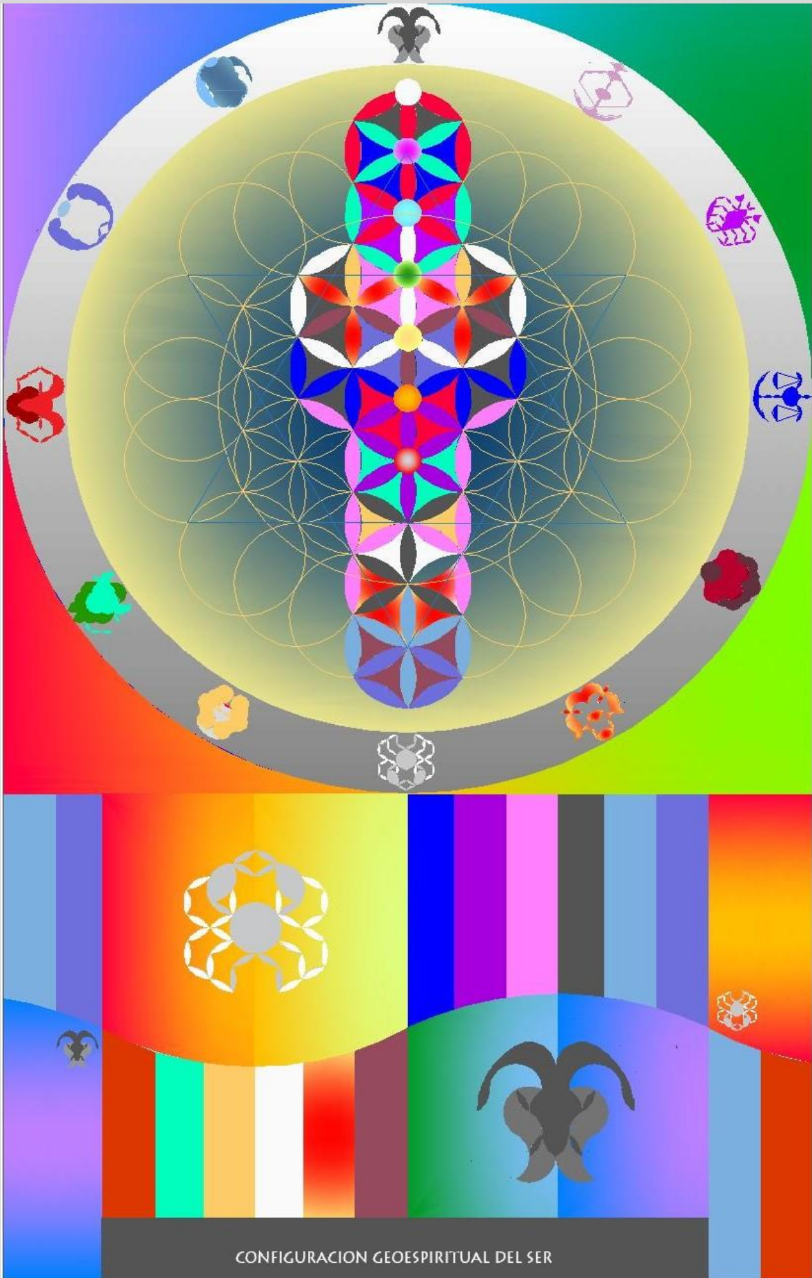
CONFIGURACION GEOESPIRITUAL DEL SER